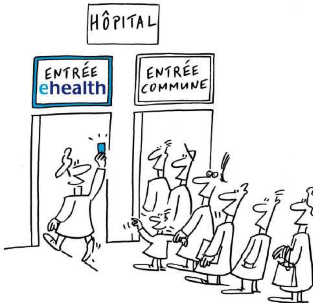
PFH SCHI - CARTOON